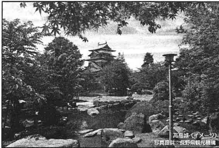
高島城 (イメージ)